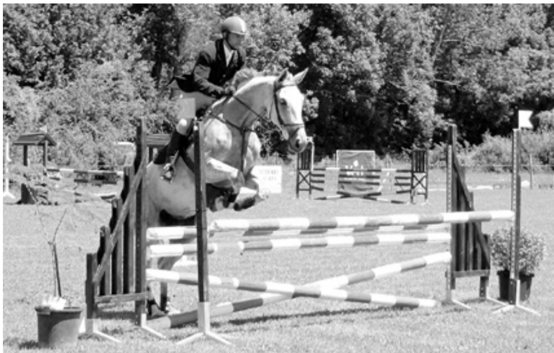
Los caballos vuelven a la Ribagorza. s.e.

En cada una de las pruebas se entregarán trofeos a los tres primeros clasificados, y premios