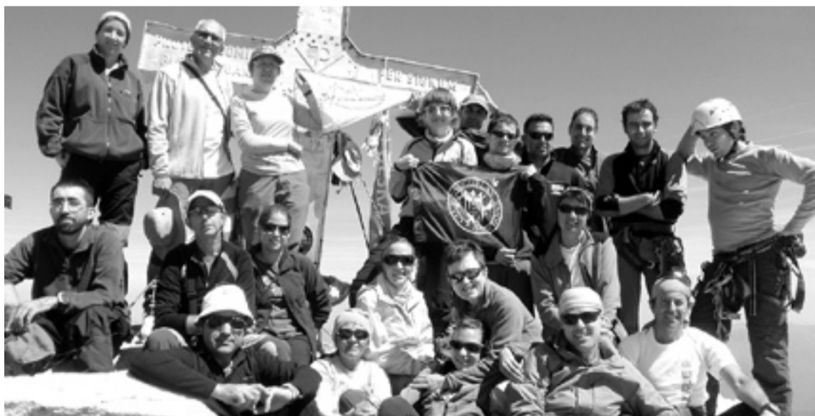
El grupo de literanos, en la cima del Aneto. s.e.

La noche es corta en el refugio y mucho antes de que amanezca ya hay una gran actividad por todos los rincones. Hay que desayunar y preparar mochilas para empezar a caminar lo antes posible. La ola de calor que nos invade aconseja coger altura antes de que los primeros rayos del sol rebasen el pico de la Renclusa. Una serpiente lumi-